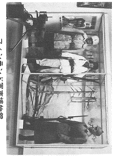
フランスの「軍事博物館」

一方、西歐の博物館は史実を忠実に展示することに力を入れている。アメリカでは戦争博物館や艦艇ミュージアムなどは、内務省観光局が管理し日本の資料を展示し忠実に史実を再現しているが、プログラムでは日本軍の陣地跡や、激しい戦闘のあった地域が国立戦争公園に指定され、現狀変更には厳しい制約を課して保護している。このため海水浴場には、日本軍に破壊されたアメリカ軍の上陸用舟艇や戦車、日本軍のトーチカなどの残骸が、そのまゝ保存され戦闘の激しさを伝えてい